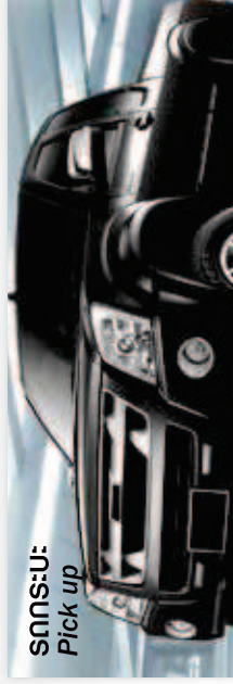
รถกระบะ Pick up

This brochure is not an insurance contract. Full details are specified in the insurance policy. เอกสารนี้เป็นใบโฆษณาประกันภัย รายละเอียดทั้งหมดสามารถตรวจสอบได้จากกรมธรรม์ประกันภัยที่กรมธรรม์ประกันภัย